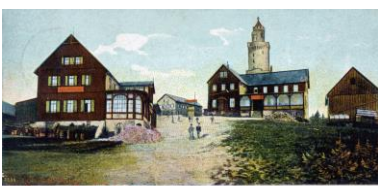
Bildpostkarte vom Gr. Feldberg, 1918

Samstag, 13. April 2024, 15.30 Uhr, Central-Garage Bad Homburg, Niederstedter Weg 5